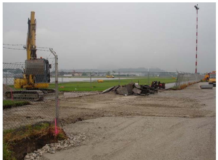
Abbildung 2: Der bestehende Zaun wurde geöffnet, eine direkte Verbindung zum Vorfeld hergestellt;