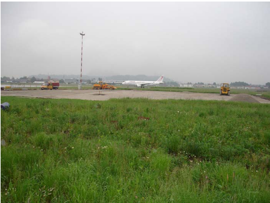
Abbildung 6: Die Lage der „provisorischen Fläche“ in der freien Landschaft : die neu errichtete Abstellfläche schließt nicht an die provisorischen Parkplätze an, sondern ist durch einen ca. 30 Meter breiten Grünstreifen (Widmung: Grünland) getrennt.

Entgegen den Feststellungen im Bericht des Baurechtsamtes vom 20.05.08 liegt die neu errichtete Abstellfläche zweifelsfrei in der freien Landschaft.