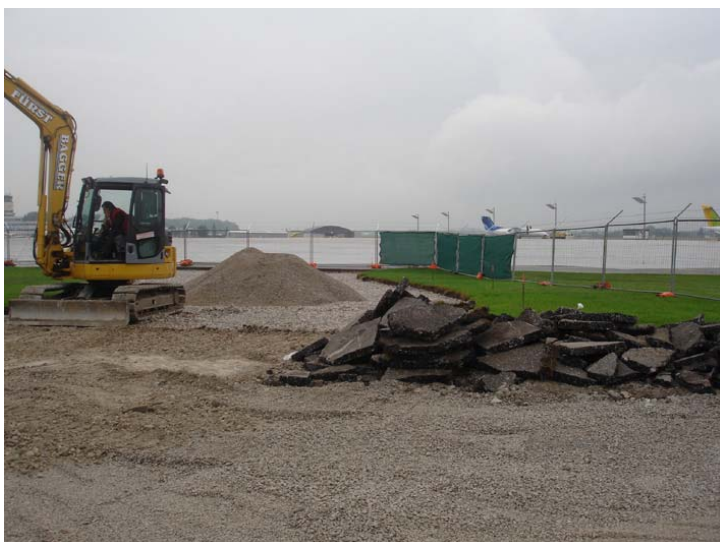
Abbildung 2: Blick von der „provisorischen Abstellfläche“ zum Flughafenvorfeld; Herstellung einer direkten Anbindung, Öffnung des Flughafenzauns;

3 = ein neuer Flughafenzaun wird um die Abstellfläche incl. einer 30 Meter breiten Grünfläche errichtet.