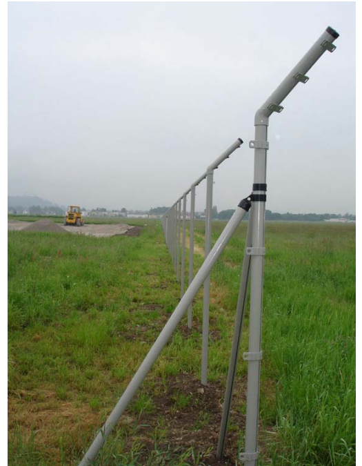
Abbildung 4+ 5: die „provisorische“ Fläche und zusätzlich ein 30 Meter breiter Grünstreifen zwischen „provisorischer Abstellfläche“ und „provisorischen Parkflächen“ wurden neu eingezäunt und an das bestehende Flughafengelände angebunden;